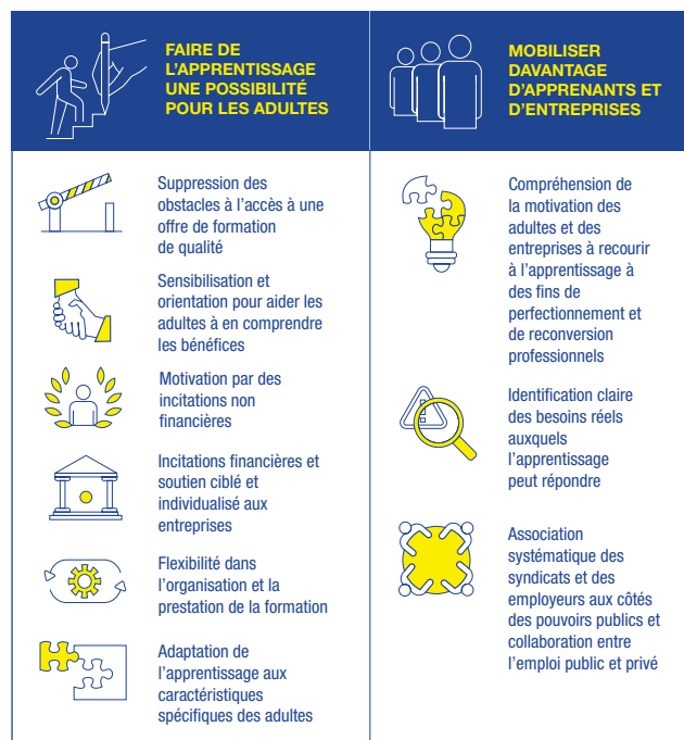
Graphique 4. Comment tirer le meilleur parti de l'apprentissage pour adultes

Les enseignants et formateurs d'EFP jouent un rôle essentiel dans la révolution des compétences. La cartographie 2022 des approches nationales en matière de développement professionnel initial et continu du Cedefop montre les défis auxquels sont confrontés enseignants et formateurs dans des environnements complexes et en mutation rapide. Les enseignants doivent être informés et formés pour devenir ambassadeurs de la double transition (verte et numérique) et changer l'état d'esprit des apprenants. En 2023 ou début 2024, le Cedefop lancera la toute première enquête européenne auprès des enseignants et des formateurs afin d'évaluer leur degré de préparation aux défis qui les attend.