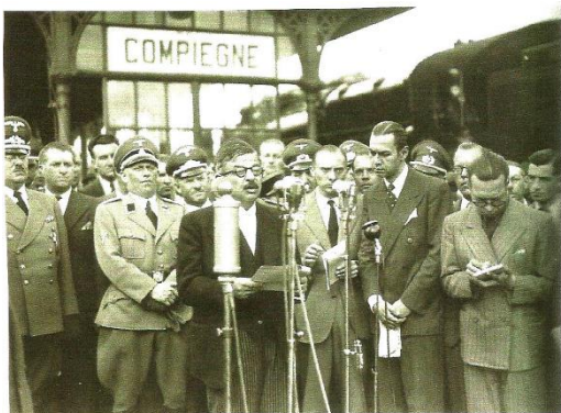
11 août 1942 : LAVAL accueille le retour de prisonniers à Compiègne.