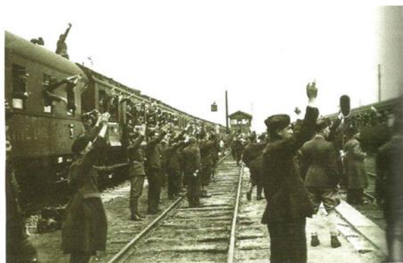
11 août 1942 : départ du train emportant les ouvriers pour l'Allemagne

Le 23 juin 1942, Hubert LAGARDELLE écrit aux préfets et inspecteurs divisionnaires du travail 89 que « la Relève des prisonniers repose sur l'action des offices du travail français agissant en collaboration étroite avec les services allemands chargés des questions de main-d'œuvre ». Les services doivent, sous 48 heures, faire imprimer des fiches à remplir sur place par les intéressés avec l'appui des agents de l'office. Des statistiques de contrats signés et de départs doivent être envoyées le lundi de chaque semaine et seront confrontées aux statistiques allemandes. Pendant plusieurs semaines, l'une des préoccupations des services français est de récupérer les statistiques relatives aux spécialistes recrutés directement par les bureaux allemands. Le 1 er juillet 1942, Jean TERRAY, le secrétaire général du ministère du Travail réunit les inspecteurs divisionnaires pour commenter les circulaires des 10 et 23 juin 1942 et examiner leurs difficultés d'application. Les divisionnaires lui indiquent que les inspecteurs du travail apportent un « appui loyal » aux bureaux allemands 90 .