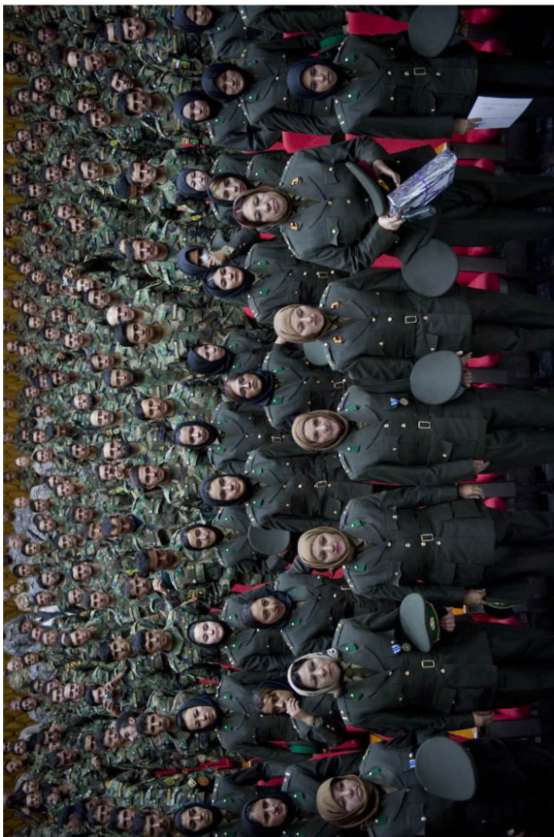
Les femmes sont de plus en plus présentes dans les armées mais avec des spécificités liées aux tâches qui leur sont attribuées et à leur place dans la hiérarchie. Ici la cérémonie de remise de leurs insignes à des femmes officières de l'armée afghane (Kaboul 23 septembre 2010).