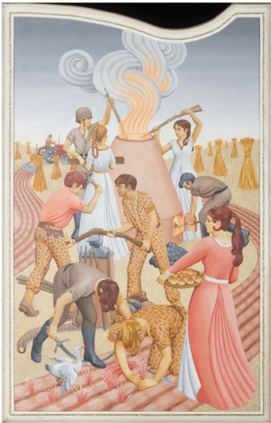
Dans le Pentikon de l'artiste Peter Koenig, la femme qui participe à la destruction des armes correspond au cliché de la femme « naturellement » pacifiste. © Basilique de Koekelberg, Musée d'art religieux moderne / Dotcame.