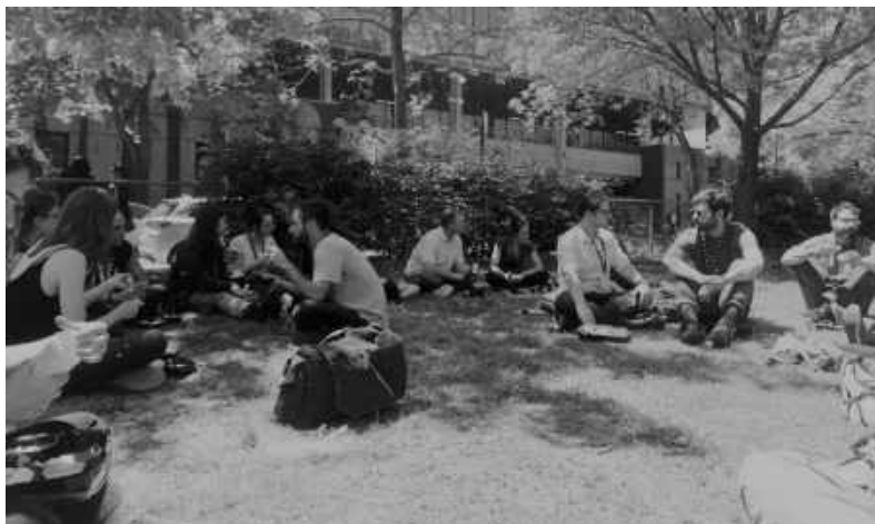
Colloque interuniversitaire sur la jeunesse (CIJ), 7 juin 2019, ENAP, Montréal