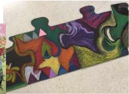
Exemples de créations artistiques réalisées à l'Espace Jeunes ACCESS Parc-Extension