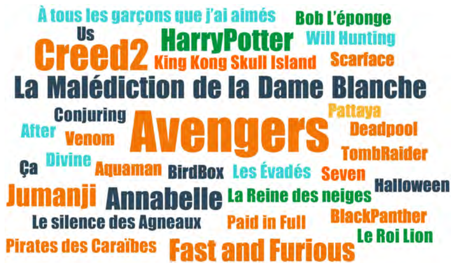
FIGURE 4. TITRES DE FILMS CITÉS PAR LES ADOLESCENT·E·S DE VILLEJUIF EN ENTRETIEN

La taille des titres reflète la fréquence de citation en entretien : la plupart des titres sont cités une fois ; Avengers est cité 5 fois ; Creed 2 3 fois ; Fast and Furious , Harry Potter , La Malédiction de la Dame Blanche , Jumanji et Annabelle 2 fois.