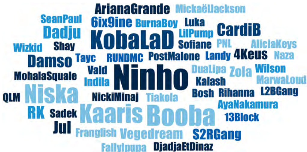
FIGURE 2. ARTISTES CITÉS PAR LES ADOLESCENT-E-S DE VILLEJUIF PENDANT LES ENTRETIENS

La taille du nom des artistes reflète la fréquence de citation en entretien : la plupart ont été cités une fois ; Ninho est cité 9 fois ; Booba 7 fois ; Koba La D, Niska et Kaarie 6 fois ; Dadju, Damso, RK, Jul et Cardi B 3 fois, etc.