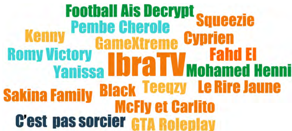
FIGURE 6. CHAINES YOUTUBE REGARDÉES PAR LES ADOLESCENT·E·S DE VILLEJUIF

La taille des titres reflète la fréquence de citation en entretien : tous les youtubeurs et youtubeuses ont été cités une fois à l'exception d'IbraTV, cité 2 fois.