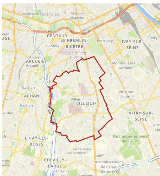
FIGURE 1. SITUATION TERRITORIALE DE LA VILLE DE VILLEJUIF