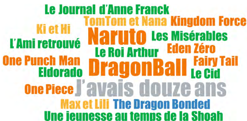
FIGURE 3. TITRES D'OUVRAGES CITÉS PAR LES ADOLESCENT·E·S DE VILLEJUIF PENDANT LES ENTRETIENS

La taille des titres reflète la fréquence de citation en entretien : la plupart ont été cités une fois ; J'avais douze ans , Naruto et Dragon Ball ont été cités 2 fois.