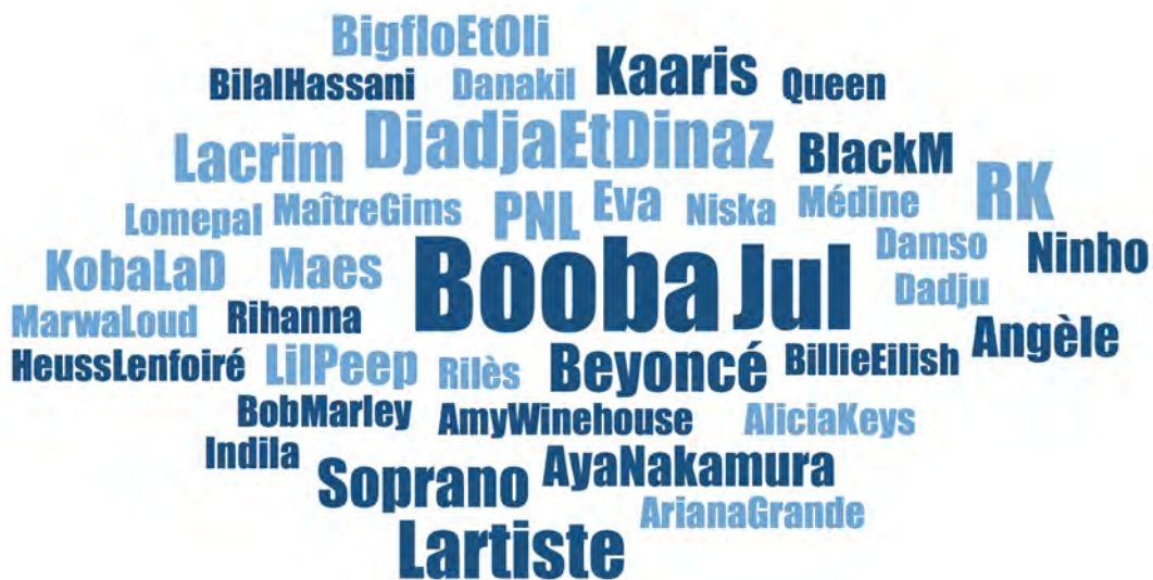
FIGURE 1. ARTISTES CITÉS PAR LES ADOLESCENT-E-S DE BOURGOÏN-JALLIEU PENDANT LES ENTRETIENS

La taille du nom des artistes reflète la fréquence de citation en entretien : la plupart ont été cités une fois ; Booba est cité 9 fois ; Jul 8 fois ; L'artiste, Djadja & Dinaz et RK 5 fois, etc.