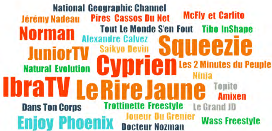
FIGURE 4. CHAINES YOUTUBE REGARDÉES PAR LES ADOLESCENT·E·S DE DAMMARIÉ-LES-LYS

La taille des titres reflète la fréquence de citation en entretien : la plupart ont été cités une fois ; Cyprien, Le Rire Jaune, Squeeze et Ibra TV sont cités 3 fois ; Junior TV, Norman et Enjoy Pheonix 2 fois.