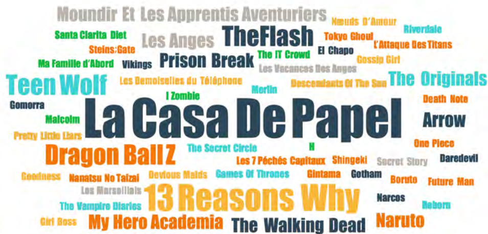
FIGURE 3. TITRES DE SÉRIES CITÉS PAR LES ADOLESCENT·E·S EN ENTRETIEN