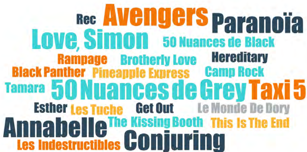
FIGURE 5. TITRES DE FILMS CITÉS PAR LES ADOLESCENT·E·S EN ENTRETIEN

La taille des titres reflète la fréquence de citation en entretien : Avengers est cité 3 fois ; Paranoïa , Love, Simon , Taxi 5 , 50 nuances de Grey , Annabelle et Conjuring sont cités 2 fois. Les films d'une même franchise ont été réunis ( Avengers 2 et Avengers 3 ; Conjuring et Conjuring 2 ).