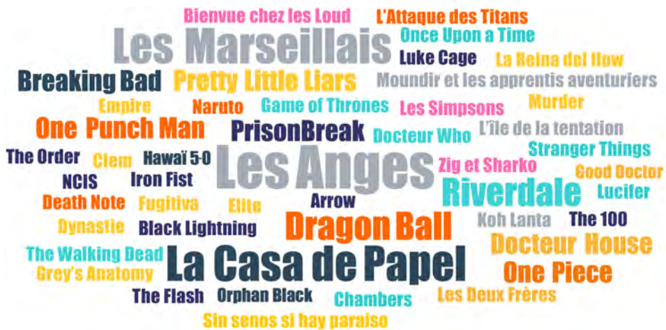
FIGURE 5. TITRES DE SÉRIES CITÉS PAR LES ADOLESCENT·E·S DE VILLEJUIF EN ENTRETIEN

La taille des titres reflète la fréquence de citation en entretien : Les Anges est citée 5 fois ; La Casa de Papel et Les Marseillais 4 fois ; Riverdale et Dragon Ball 3 fois ; Docteur House , Breaking Bad , One Punch Man , Pretty Little Liars , One Piece et Prison Break 2 fois.