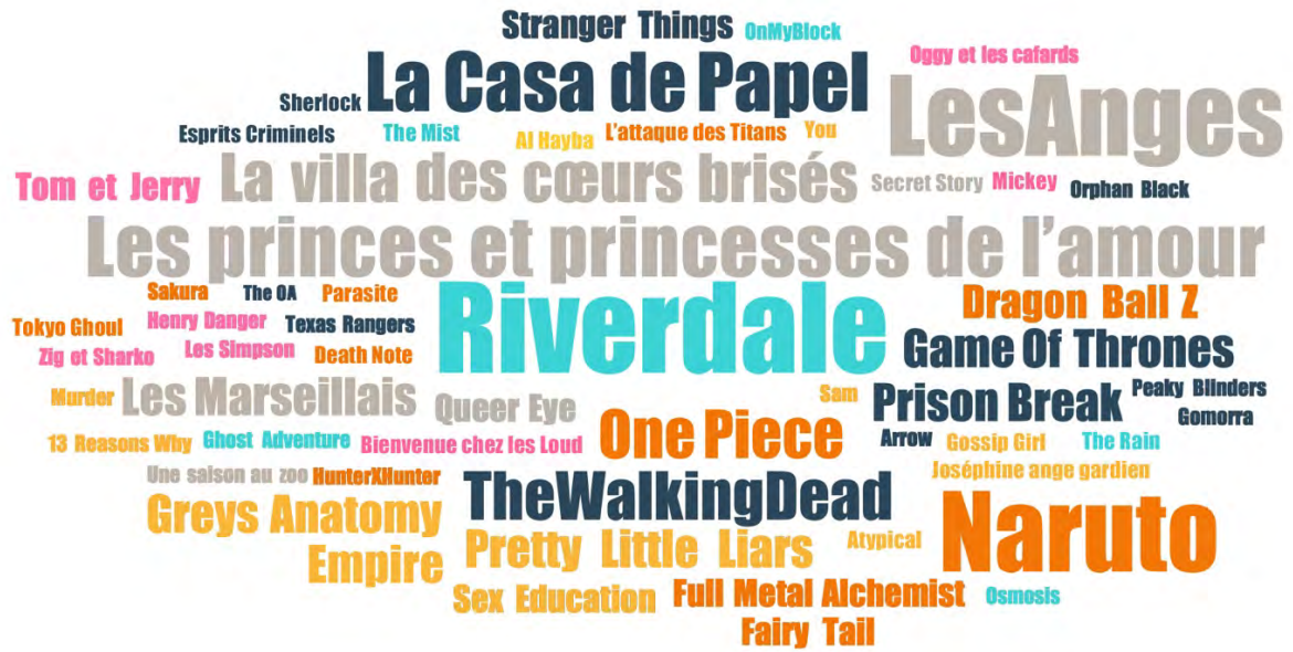
FIGURE 4. TITRES DE SÉRIES CITÉS PAR LES ADOLESCENT·E·S DE BOURGOIN-JALLIEU EN ENTRETIEN

La taille des titres reflète la fréquence de citation en entretien : Riverdale est citée 8 fois ; Les Anges et Naruto 7 fois ; Les princes et princesses de l'amour 6 fois ; La Casa de Papel 5 fois ; La villa des cœurs brisés , The Walking Dead et One Piece 4 fois ; Les Marseillais , Game of Thrones et Prison Break 3 fois, etc.