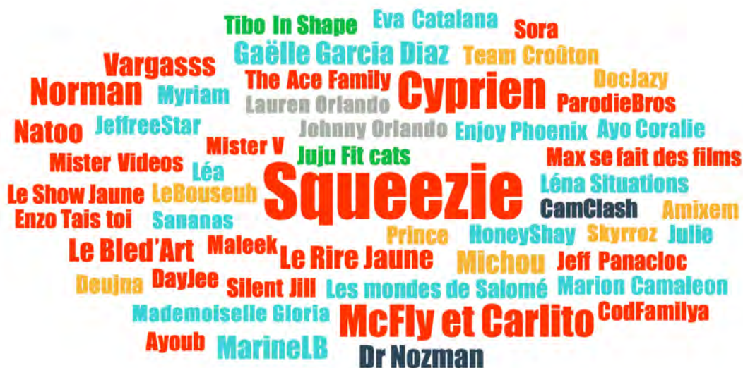
FIGURE 5. CHAINES ET VIDEASTES CITES PAR LES ADOLESCENT·E·S DE BOURGOIN-JALLIEU EN ENTRETIEN

La taille des noms reflète la fréquence de citation en entretien : la plupart ont été cités une fois ; Squeezie est cité 9 fois ; Cyprien 5 fois ; Mac Fly et Carlito 4 fois ; Norman 3 fois ; Nattoo, Le Rire Jaune, Marine LB, Dr Nozman, Le Bled'Art, Vargasss, Michou et Gaëlle Garcia Diaz 2 fois.