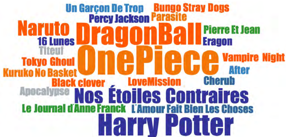
FIGURE 2. TITRES D'OUVRAGES CITÉS PAR LES ADOLESCENT·E·S PENDANT LES ENTRETIENS

La taille des titres reflète la fréquence de citation en entretien : la plupart ont été cités une fois ; One Piece est cité 4 fois ; Dragon Ball et Harry Potter 3 fois ; Naruto et Nos Étoiles contraires 2 fois.