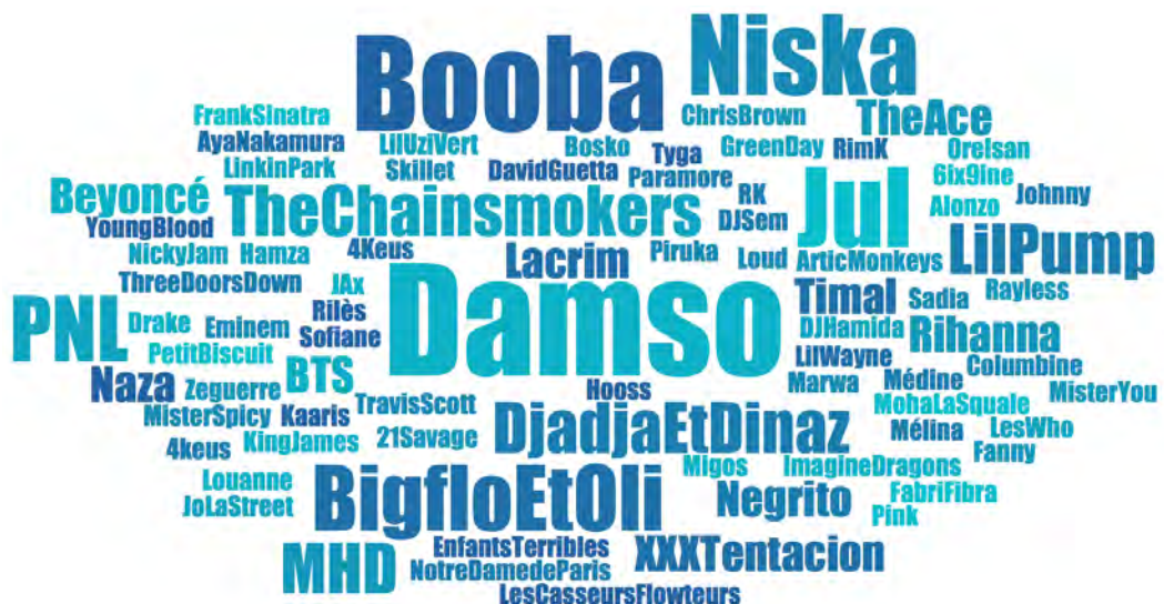
FIGURE 1. ARTISTES CITÉS PAR LES ADOLESCENT·E·S PENDANT LES ENTRETIENS

La taille du nom des artistes reflète la fréquence de citation en entretien : la plupart ont été cités une fois ; Damso est cité 9 fois ; Booba 8 fois ; Jul et Niska 6 fois ; PNL, Big Flo & Oli et MHD 4 fois ; Negrito, The Chainsmokers, Djadja & Dinaz et Lil Pump 3 fois, etc.