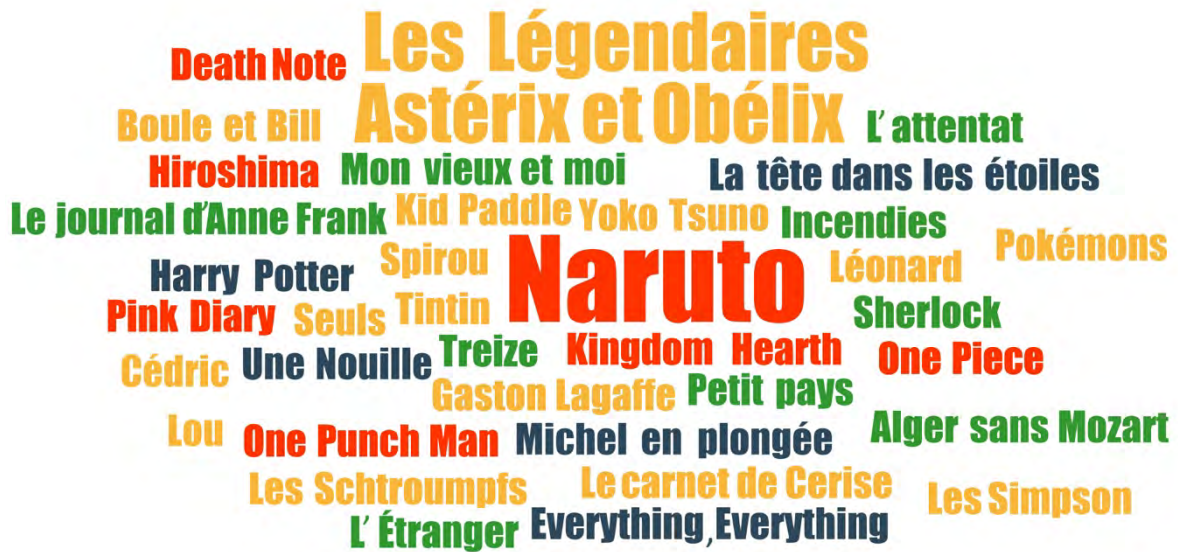
FIGURE 2. TITRES D'OUVRAGES CITÉS PAR LES ADOLESCENT·E·S DE BOURGOIN-JALLIEU PENDANT LES ENTRETIENS

La taille des titres reflète la fréquence de citation en entretien : la plupart ont été cités une fois ; Naruto est cité 3 fois ; Les Légendaires et Astérix et Obélix 2 fois.