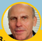
BERNARD PÊCHEUR, Président de la section de l'administration du Conseil d'État