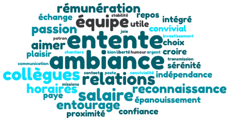
GRAPHIQUE 1. PREMIER ÉLÉMENT CITÉ POUR ÊTRE HEUREUX/HEUREUSE AU TRAVAIL 2

Les jeunes ont ainsi une perception commune ou très proche quant aux éléments importants pour être heureuse/heureux au travail. Pour autant, la conciliation entre travail et vie de famille se dévoile davantage dans les propos de femmes à la recherche de leur indépendance. Par exemple, Laurie, à son compte, attachée aux conditions de satisfaction fréquemment avancées (ambiance, tâche, rémunération), orchestre sa journée type de la façon suivante :