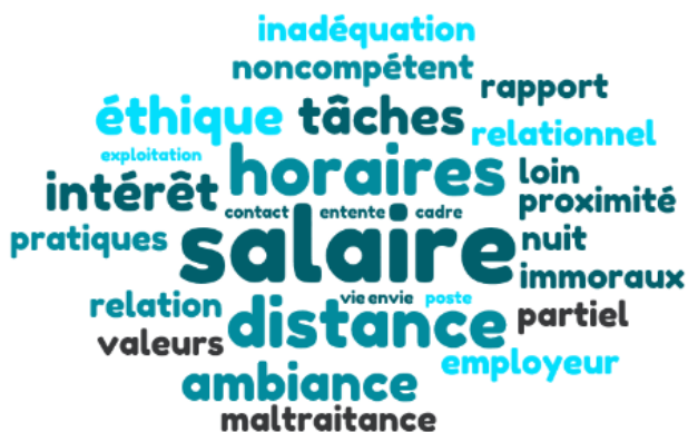
GRAPHIQUE 2. PREMIER ÉLÉMENT CITÉ POUR REFUSER UN EMPLOI