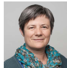
Par Anne-Françoise Gibert

Ce Dossier, loin d'épuiser la richesse que constitue l'enseignement agricole, va se concentrer sur deux questions : dans quelle mesure l'organisation de l'enseignement agricole permet-elle la prise en compte de savoirs professionnels, technologiques et scientifiques qui ont évolué et qui évoluent toujours aujourd'hui ? Comment accompagner la diversité des élèves de l'enseignement agricole dans des projets professionnels et éducatifs les préparant au mieux à l'évolution de ces savoirs ?