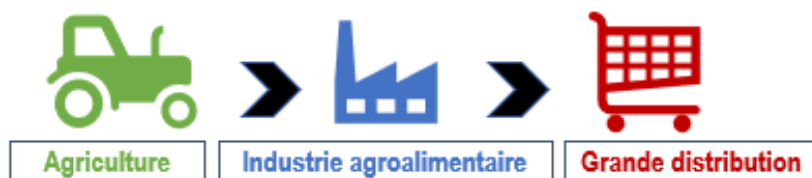
Figure 1 : L'industrie agroalimentaire et ses activités connexes

De plus, comme l'explique Butault (2008), la relation entre prix agricoles et prix des produits alimentaires issus de l'industrie agroalimentaire est un facteur qui a été beaucoup étudié à travers la littérature. En effet, l'industrie agroalimentaire est l'activité grâce à laquelle les produits bruts issus de l'agriculture sont transformés en produits finis, prêts à être commercialisés à travers les réseaux de distribution. Cette industrie est donc l'intermédiaire entre deux activités, l'agriculture en amont et la grande distribution en aval, qui se caractérisent par des mécanismes de formation des prix assez différents.