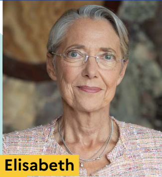
Mme Elisabeth BORNE,

ministre d'État, ministre de l'Éducation nationale, de l'Enseignement supérieur et de la Recherche