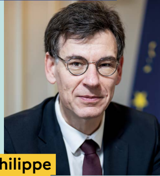
M. Philippe BAPTISTE,

ministre d'État, ministre de l'Éducation nationale, de l'Enseignement supérieur et de la Recherche